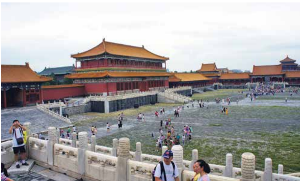
Zakazane Miasto to jeden z największych kompleksów pałacowych na świecie