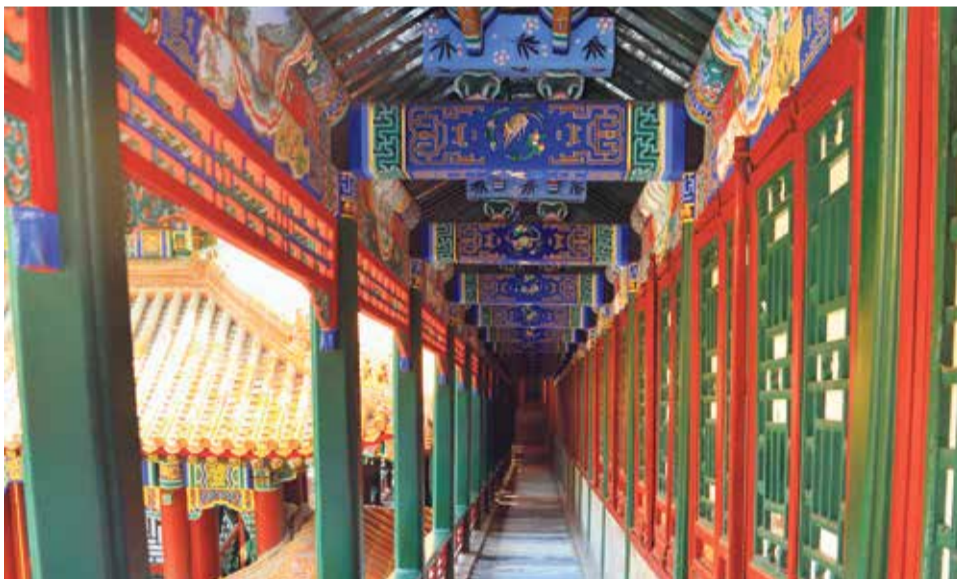
Korytarz w Letnim Pałacu zwraca uwagę bogactwem kolorów