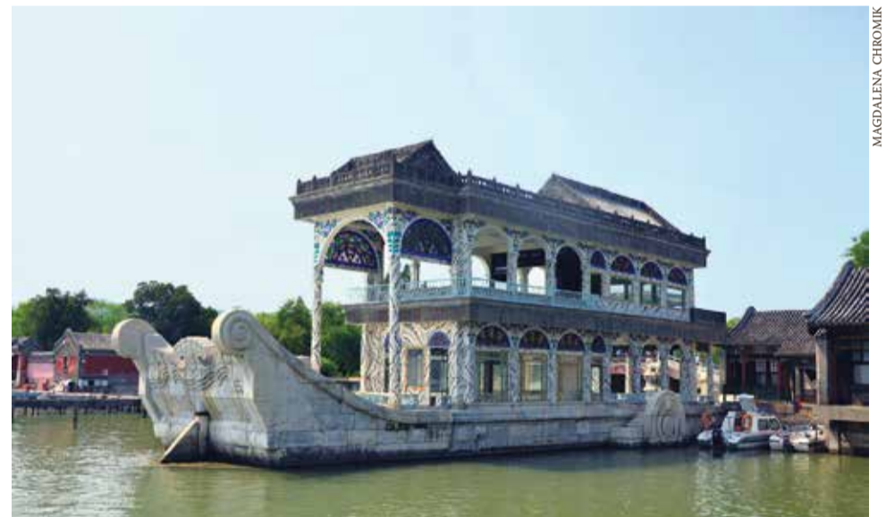
Marmurowa łódź cesarzowej Cixi została ufundowana ze środków przeznaczonych na rozbudowę floty